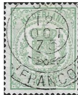
Oss laatste datum 12-10-1875