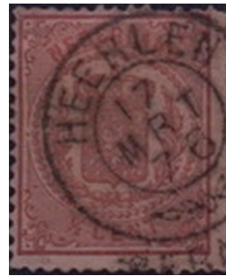
Heerlen laatste datum 17-03-1876