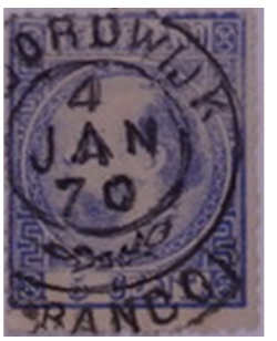
Noordwijk vroegste datum 04-01-1870