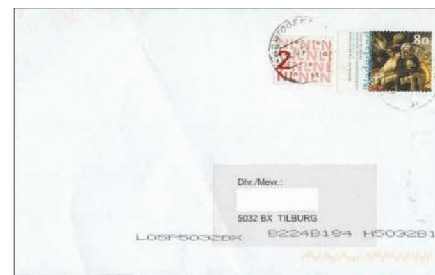
cijferzegel van 2 eurocent als bijplakzegel bij een postzegel van 80 cent, 20 september 2002.

In onderstaande afbeelding is het gebruik van de cijferpostzegel van 2 eurocent als aanvullingswaarde te zien in combinatie met een postzegel van 80 cent. Deze combinatie is in bovenstaande tabel vermeld als mogelijk gebruik.