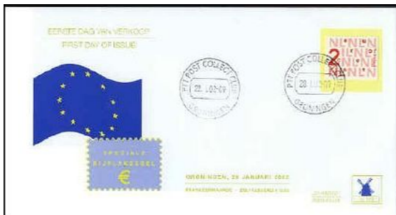
FDC cijferzegel van 2 eurocent, uitgegeven op 28 januari 2002

Door TPG POST Collect Club zijn er ook losse zegels van 2 eurocent geleverd in een "Speciale set basisassortiment 2002". Deze zegels waren niet (zoals bijvoorbeeld de zelfklevende cijferzegels type Crouwel) gestanst, maar uitgeknipt / gesneden uit de geïntegreerde blokjes.