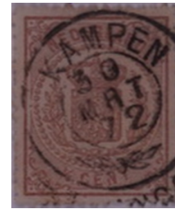
Kampen vroegste datum 30-03-1872