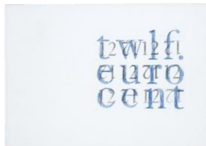
nog 2 ontwerpen van Walter Nikkels voor de 12 cent