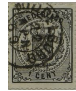
Middelburg vroegste datum 22-04-1869