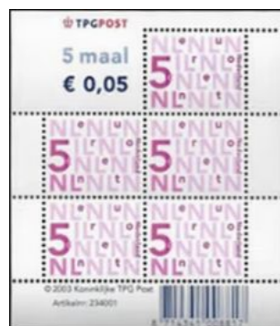
Cijferzegel van 5 eurocent: Velletje van 5 uitgegeven op 2 januari 2003 en het velletje van 10 eurocent uitgegeven in 2005

Op het velletje staat het logo TPGPOST in rood en blauw. De tekst luidt: 5 maal € 0,05 . Aan de onderkant van het velletje staat de barcode (8714341008817), alsmede de aanduiding (c) 2003 Koninklijke TPGPost en het artikelnummer: Artikelnr. 234001 . Tekst en barcode in blauw. De zegels zijn gedrukt door The House of Questa, op een ATN-pers in Byfleet, Surrey (volgens R.C. Bakhuizen van den Brink, zie ook Jaarboek Nederlandse Postzegels 2003, blz. 15); in rasterdiepdruk (raster 110) op niet fosforescent papier van Tullis Russell en voorzien van I-vormige fosforbalken, welke geel oplichten onder een UV-lamp.