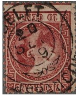
Delft vroegste datum 20-09-69