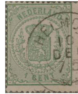
Helmond laatste datum 10-12-1875