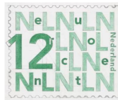
ontwerp 12 c

Opmerkelijk is dat de letter 'c' bij de verschillende waarden niet overal op de zelfde plaats ten opzichte van het waardecijfer staat. Vergelijk ook de positie van de 'c' bij de 12 cent met het boven afgebeelde ontwerp, waar de 'c' achter de 12 staat!