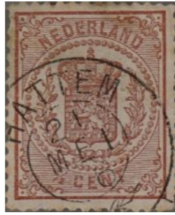
Hattum laatste datum 21-05-1876