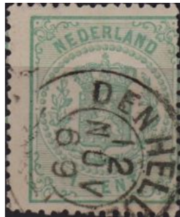
Den Helder vroegste datum 12-11-1869