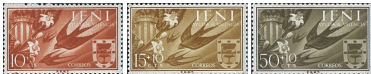
De tekst luidt: Ayuda a Valencia ofwel hulp aan Valencia

Ook de landelijke posteries deden een bijdrage. Echter niet met Spaanse postzegels, maar met zegels uit Spaanse koloniën in Marokko. Zo waren er toeslagzegels uit Ifni, een klein vissersdorpje aan de Atlantische kust: