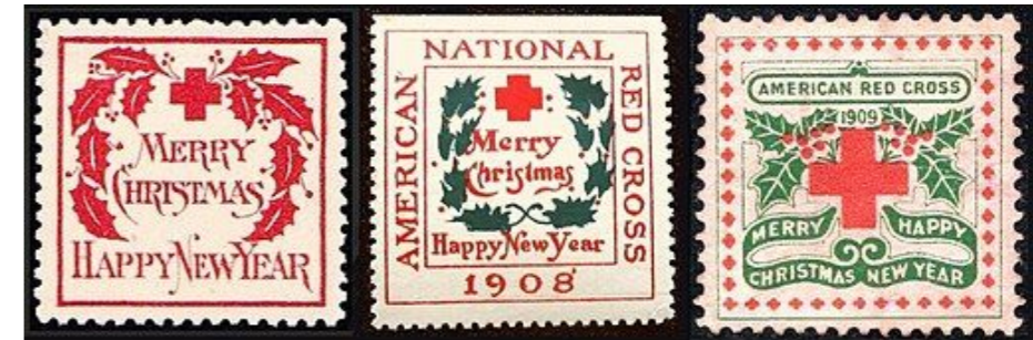
vroege voorbeelden van de christmas seals