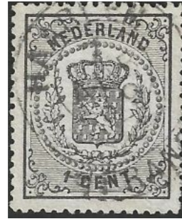
Haarlem vroegste datum 07-04-1869