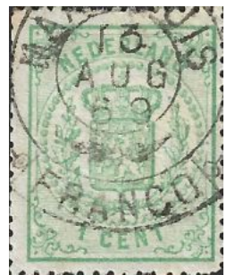
Maassluis vroegste datum 13-08-1869