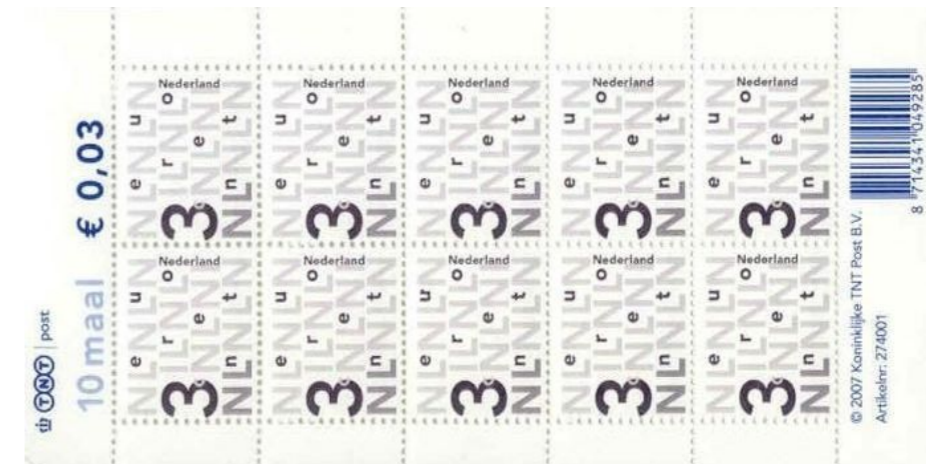
Cijferzegel van 3 eurocent. Velletje van 10 zegels uitgegeven op 11 december 2006.

De zegels zijn gedrukt in rasterdiepdruk (drukrichting rechts, raster 100) op niet fosforescent papier met synthetische gom, en voorzien van (L-vormige) fosforbalken, die onder een UV-lamp geel oplichten. De synthetische (Tullis Russell) gom is crème van kleur, later blauw.