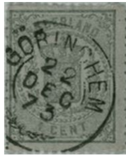
Gorinchem vroegste datum 22-12-1873