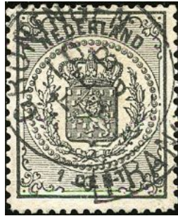
Groningen vroegste datum 10-02-1869