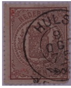
Hulst laatste datum 09-10-1875