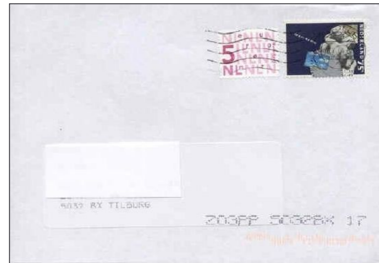
Bijplakzegel op binnenlandse brief (tarief € 0,39)

De in rasterdiepdruk gedrukte zegels hebben nu raster 100 en een L-vormige fosforband.