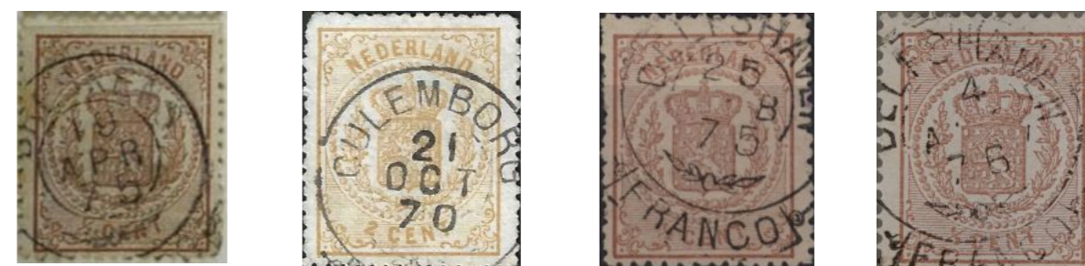
Breskens laatste datum 19-04-1875