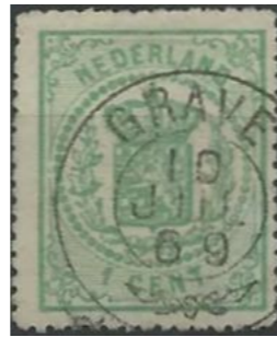
Grave vroegste datum 10-07-1869