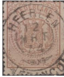
Heerlen vroegste datum 12-03-1874