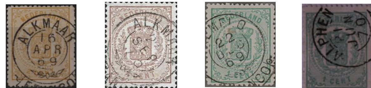
Alkmaar vroegste datum 16-04-1869