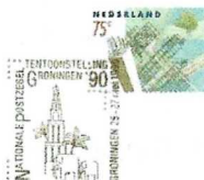
Afb. 93, Nationale postzegeltentoonstelling 25-27 mei 1990